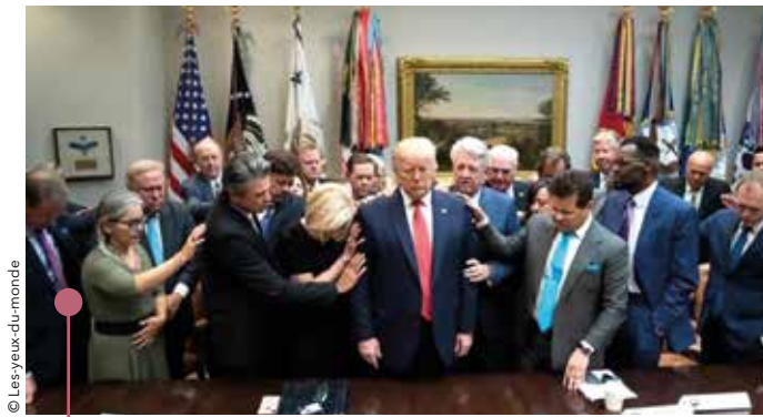
Évangéliques priant pour Donald Trump

Plusieurs des actions politiques du Président Trump servent les objectifs des évangéliques qui l'ont soutenu. Par exemple, en s'attaquant aux institutions éducatives en raison de leurs politiques progressistes, l'objectif est d'épurer l'éducation des idées jugées nuisibles à la famille traditionnelle, telles que les prises de position en faveur des personnes LGBTQ+. Lorsque Trump émet un décret exécutif pour lutter contre une prétendue « discrimination anti-chrétienne », il s'agit de limiter toute critique du christianisme au sein du gouvernement et de ses institutions. On peut légitimement se demander quel sera l'avenir des chercheurs universitaires qui abordent le christianisme d'un point de vue critique. Quant aux récentes initiatives « pro-natalistes » de Trump, qui souhaite provoquer un « Baby-Boom » aux États-Unis, elles visent avant tout à contrer la diversification raciale, ethnique et culturelle issue de l'immigration. Il s'agit de se préparer à ce qu'ils appellent le « Grand Remplacement », une théorie complotiste selon laquelle les populations blanches seraient remplacées par des populations étrangères non blanches, ayant des taux de natalité plus élevés. Cela constitue également une attaque contre les droits et la santé reproductive des